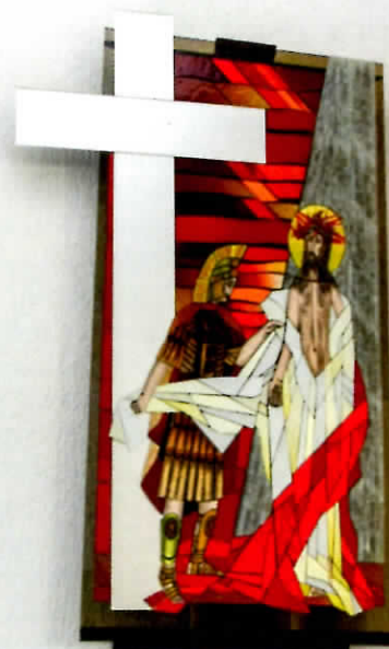
E.Valiūtė. Klaipėdos Šv. Kazimiero bažnyčios Kryžiaus kelio stočių vitražinė mozaika. 2018–2020 m. Fragmentai.