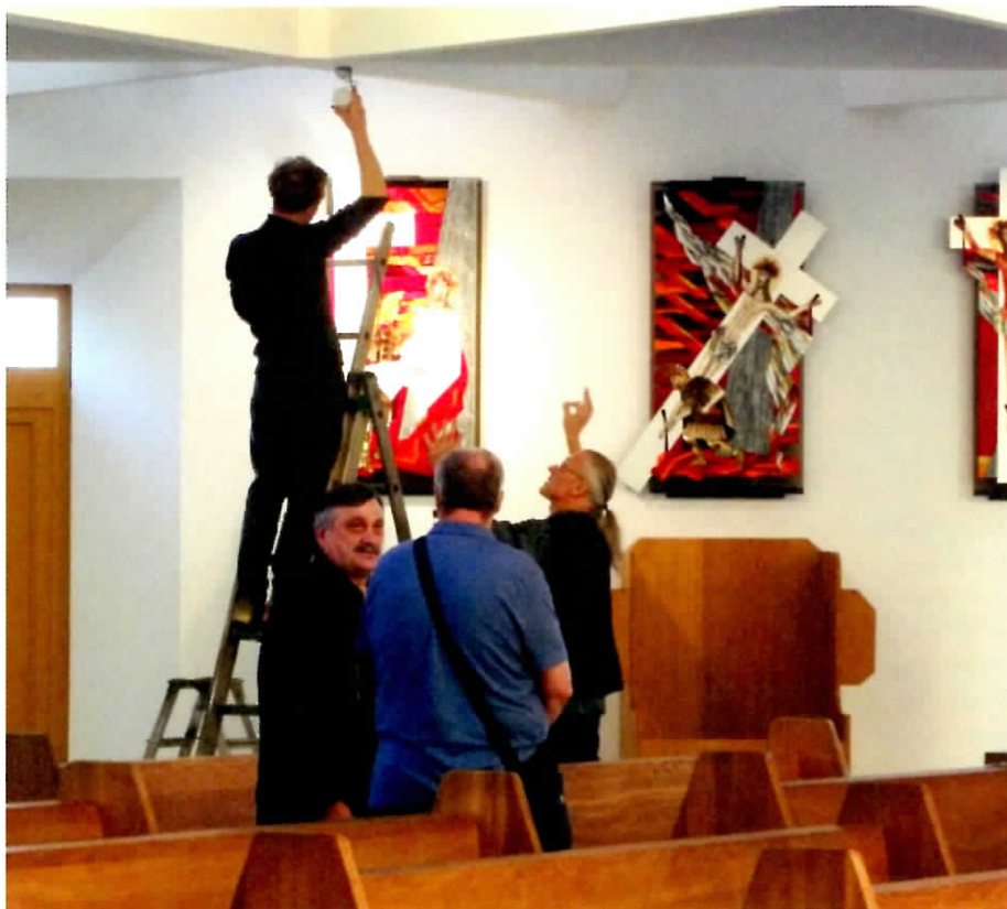
Kryžiaus kelio stočių mozaikų montavimo akimirka.