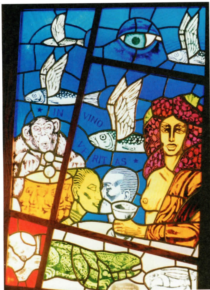
Kartu su tapytoju A.Karveliu R.Martinionis sukūrė vitražą legendinei Klaipėdos kavinei „Bohema“.

Pasakojimą apie Klaipėdos vitražų kūrėjus, savamokslus entuziastus ir romantikus, norėtusi pradėti nuo buvusiam legendinia- me vaikų darželyje veikusio menų lofto. Šis šiuolaikiškų menininkų rezidencijų pirmta- kas buvo įsikūręs Naujojoje Uosto gatvėje.