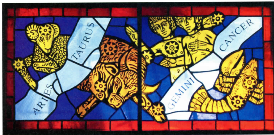
R.Martinionio ir V.Bizausko vitražai Klaipėdos laikrodžių muziejuje.