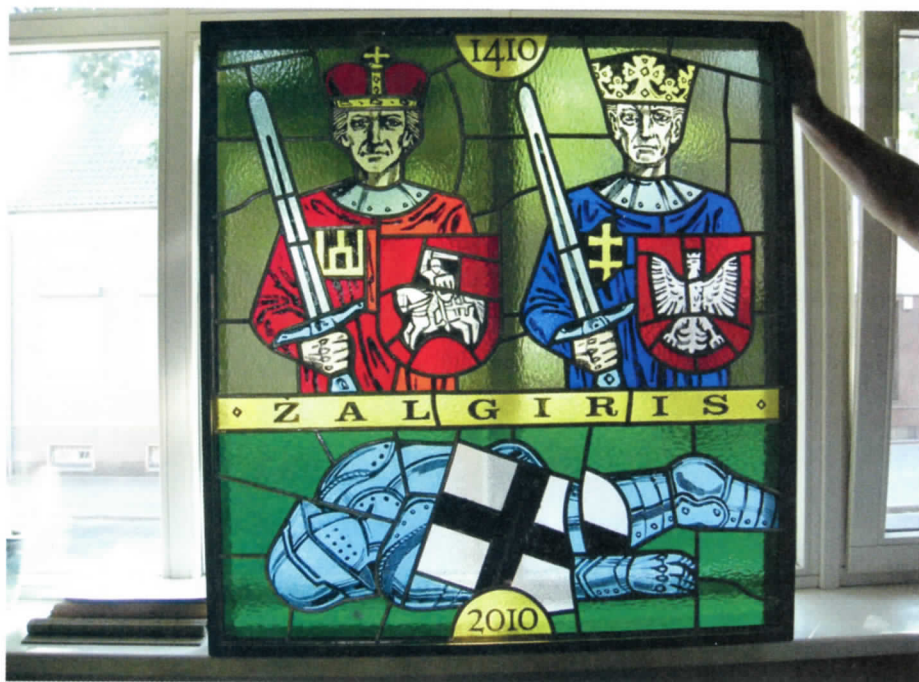
R.Martinionio ir V.Bizausko vitražas „Žalgiris“ Vytauto Didžiojo gimnazijoje Klaipėdoje.

Sugriuvus vitražinei legendiniame Darželyje , visą vitražo ūkį perėmė dizaineris V.Bizauskas.