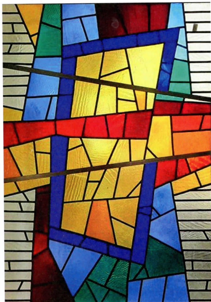
V.Bizausko vitražas uostamiesčio kavinėje „Aismarės“.