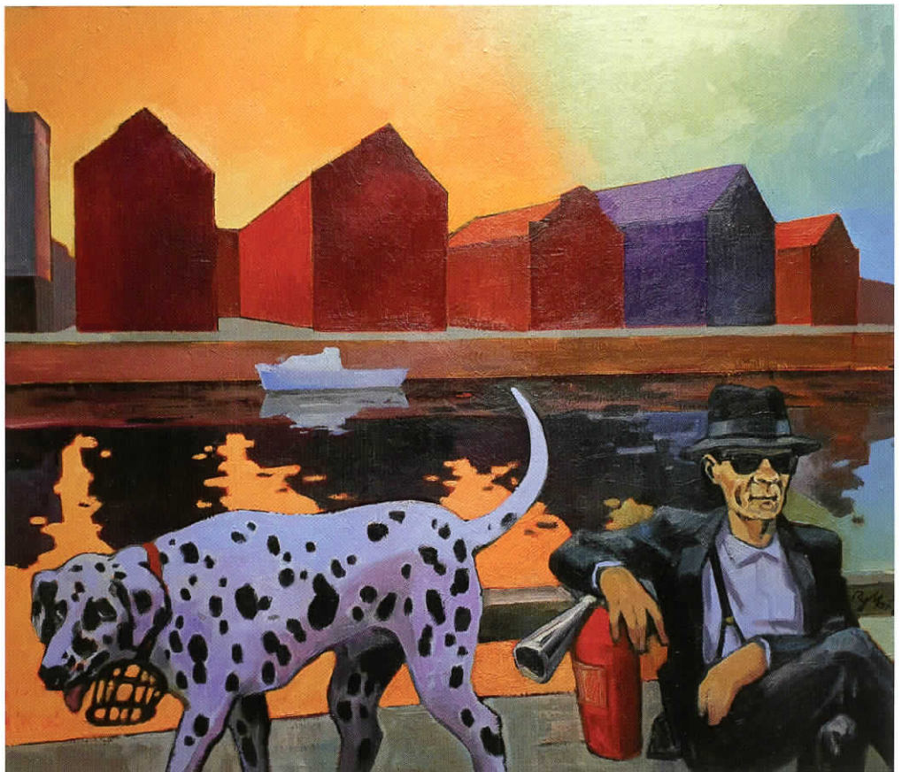
Rytis MARTINIONIS Vasarvidžio rytas. 2023 Drobė, aliejus; 112 x 96