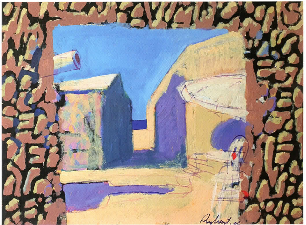
Rytis MARTINIONIS Piešinys nr. 5. 2006 Akvarėlė, popierius; 60 x 80