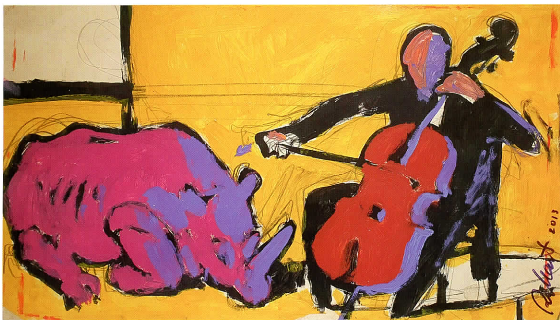
Rytis MARTINIONIS Palydos. 2013 Akvarelė, popierius; 93 x 60