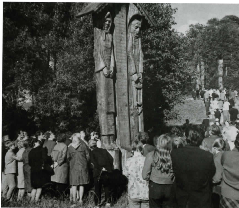
Ablingos memorialo atidarymas (1972 m.)