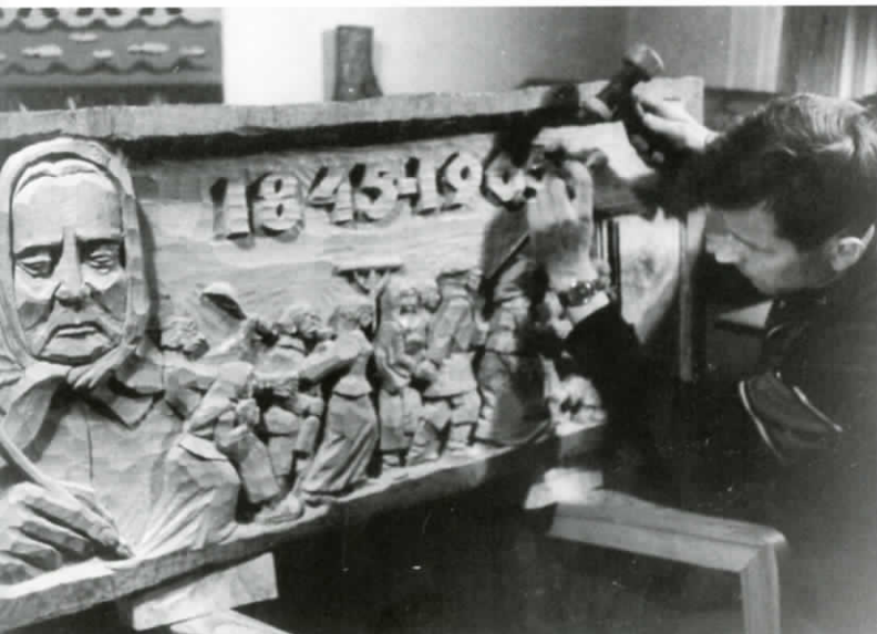
Bareljefas „Žemaitė“